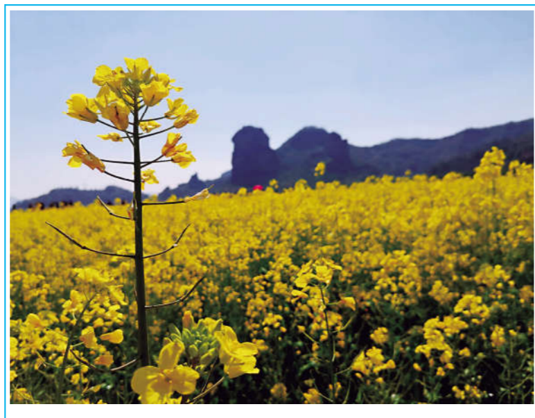
领舞

父母,也深知她能留给我们的只有一个拥抱和背影。这之后,她要向着她人生的另一个阶段进发了。就像龙应台说的:我慢慢地、慢慢地了解到,所谓父女母子一场,只不过意味着,你和他的缘分就是今生今世不断地在目送他的背影渐行渐远。你站在小路的这一端,看着他逐渐消失在小路转弯的地方,而且,他用背影告诉你:不必追。