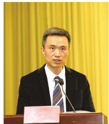
各位领导、各位来宾、各位会员:

今天我们在这里隆重召开黄岩区企业家协会第四次会员大会,大家推选我当选会长,我首先衷心感谢全体会员对我的信任和支持,同时也感到这是责任、是重托、