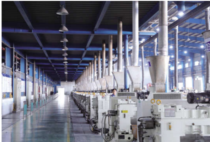
化蛹成蝶的注塑车间 公元集团 王天金摄

术人才为骨干的强大的研发团队,获国家专利700多项,主持或参与了119项国家(行业)标准的制定或修订,是行业内起草修订标准最多的企业。从中国制造到中国标准,公元集团积极争取行业话语权,以标准化来助力行业的高质量发展。 据最新消息,由公元集团参与制定的ISO9854-1:2023发布,这是公元集团,也是黄岩地区企业参与制定的首个国际标准,它是对各种塑料管道承受外力冲击的一种检验方法和手段,对各国塑料管道在生产中的应用中的耐冲击性能评价有着重要意义。这也预示着公元集团